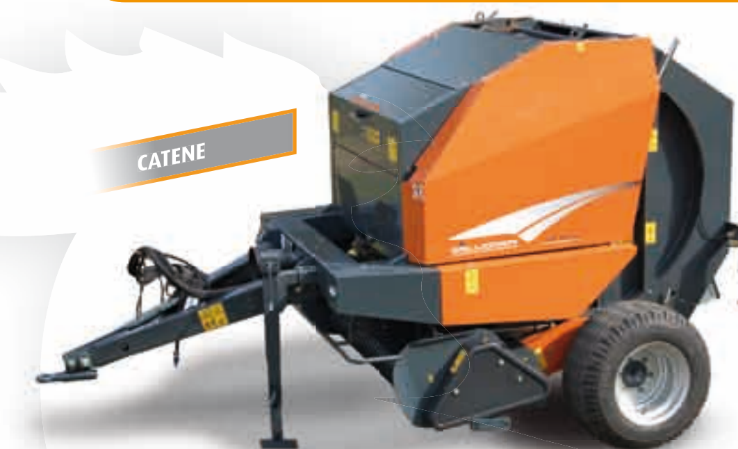
GA FB 15: SPECIFICHE TECNICHE