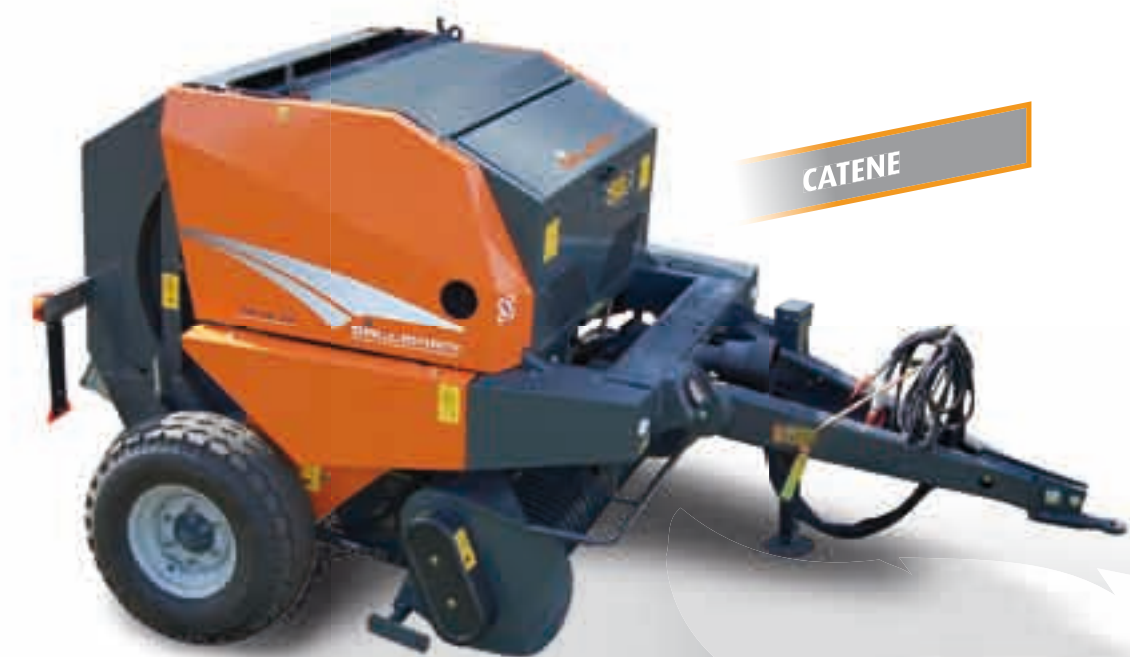
GA FB 12 SPECIFICHE TECNICHE